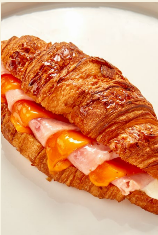
КРУАССАН С ВЕТЧИНОЙ И СЫРОМ 220Г 585