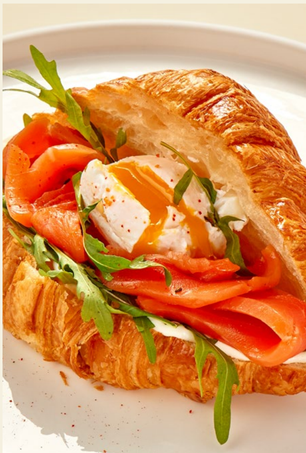
КРУАССАН С ФОРЕЛЮ, СЛИВОЧНЫМ СЫРОМ И РУККОЛОЙ 220Г 645