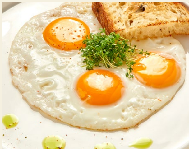
ГЛАЗУНЬЯ ИЗ ТРЁХ ЯИЦ 200Г 395