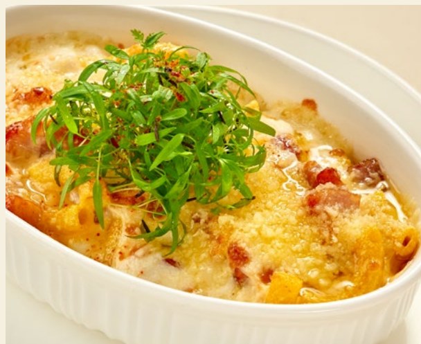
ТОРТИЛЬОНИ, ЗАПЕЧЁННЫЕ С БЕКОНОМ, ЯЙЦОМ И МОЦАРЕЛЛОЙ 220Г 520