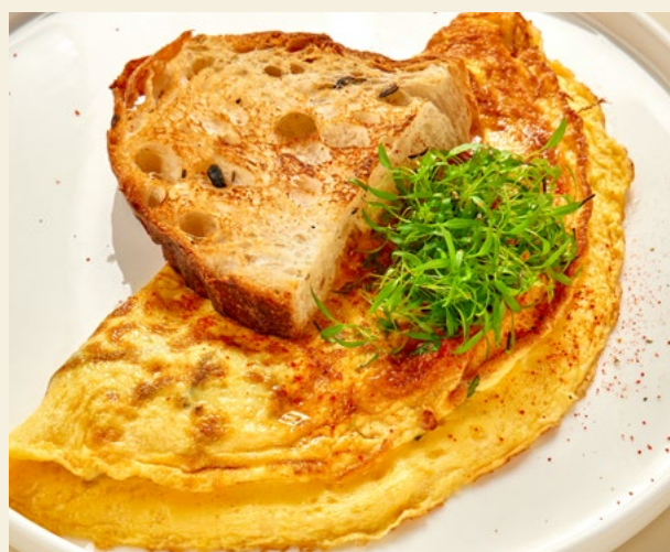
ОМЛЕТ ЗАКРЫТЫЙ С КОПЧЁНЫМ СУЛУГУНИ И СВЕЖИМ ШПИНАТОМ